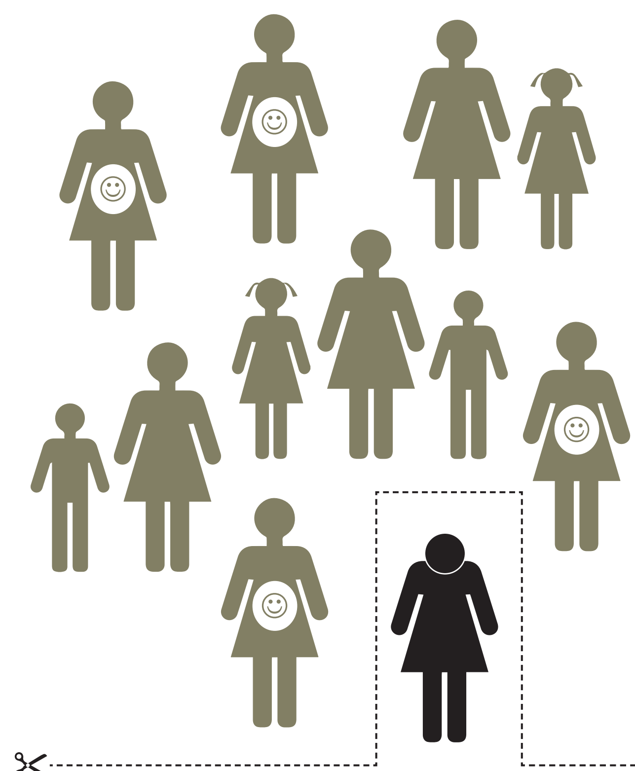
„Kui on pidu ja kõik naised hakkavad rääkima lastest, siis ma tunnen ennast seal nagu mittekaagi.”